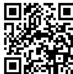
U1 グランプリ大会 QR コード